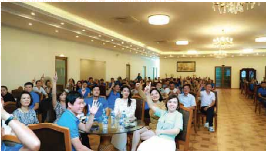
Hội thảo Doanh nhân nhân dịp kỷ niệm Ngày Doanh nhân Việt Nam 13/10