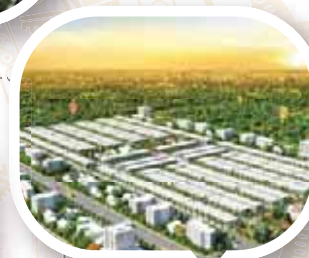
BDS nhà xưởng