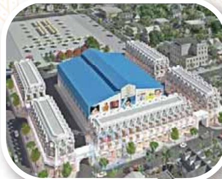
BDS Chợ - Thương mại