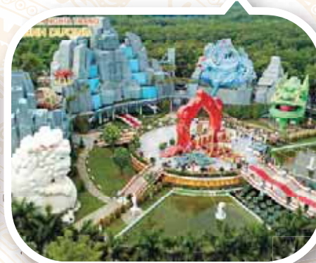
Hoa viên nghĩa trang