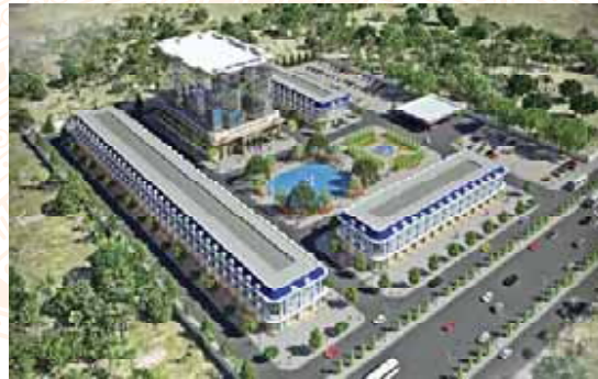
BẤT ĐỘNG SẢN