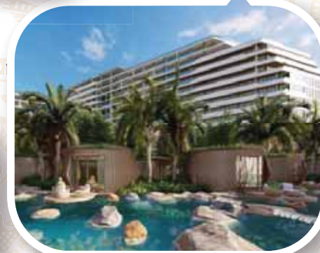
Biệt thự nghỉ dưỡng