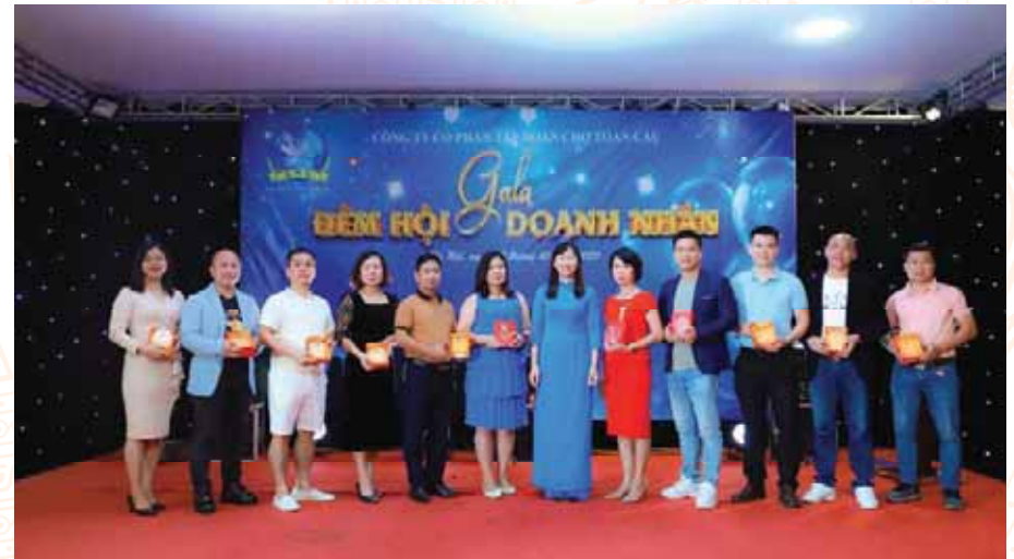
Gala Đêm hội Doanh nhân