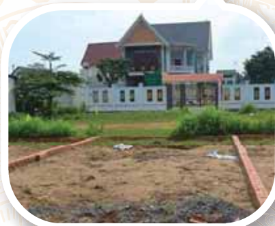
Đất nền dự án